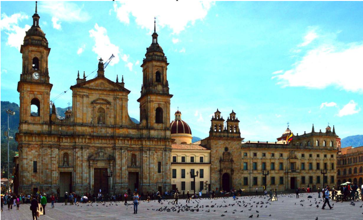
plaza Simon Bolivar

Santa Fè de Bogota. 8.000.000 ab, 2.640 m slm capitale della Colombia e del distretto di Cundinamarca. E' su un altopiano simile alla savana. Lungo il fiume Bogotà. Patria di Botero (museo). Ospita anche il Museo dell'Oro con reperti precolombiano. Bello è il suo centro storico di La Candelaria, lastricato con la Plaza de Simon Bolivar e molti edifici governativi. E' servita da un sistema di tram veloci Trans Milenio, che usano delle corsie apposite e, in pratica, funziona come una metro. I mezzi sono veloci ma, devono osservare i semafori e i momenti di traffico intenso. Le vie della città sono numerate, solo poche hanno un nome. Carrera le vie in verticale e calle in orizzontale o viceversa (non l'ho ancora capito?). Spesso non sono in ordine progressivo e solo pochi si sanno districare. senza sbagliare. Una sera ho sbagliato una via nel rientrare in hotel. Ho percorso oltre due chilometri in più e le indicazioni ricevute dai passanti erano spesso discordi tra loro.